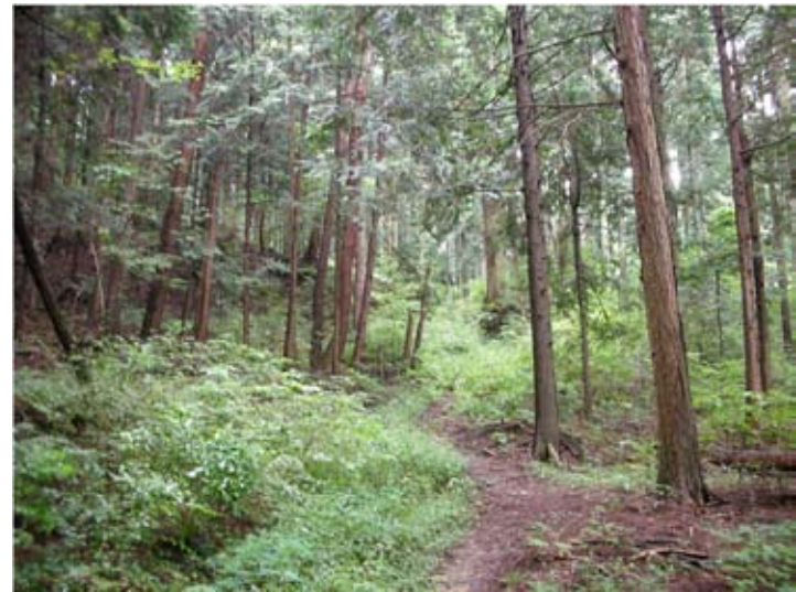
⑧隣接する学校部分林に向かう歩道