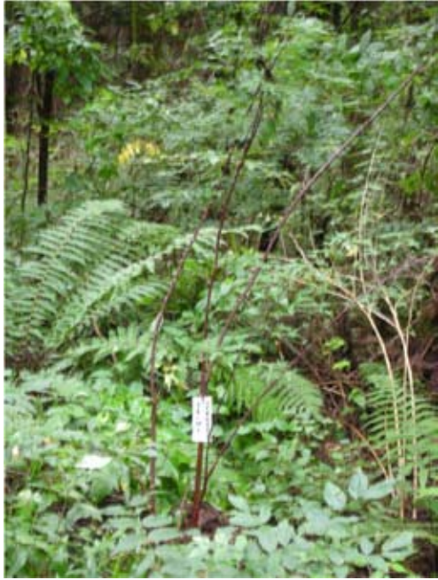
⑨高校生が歩道沿いに 実施した記念植樹