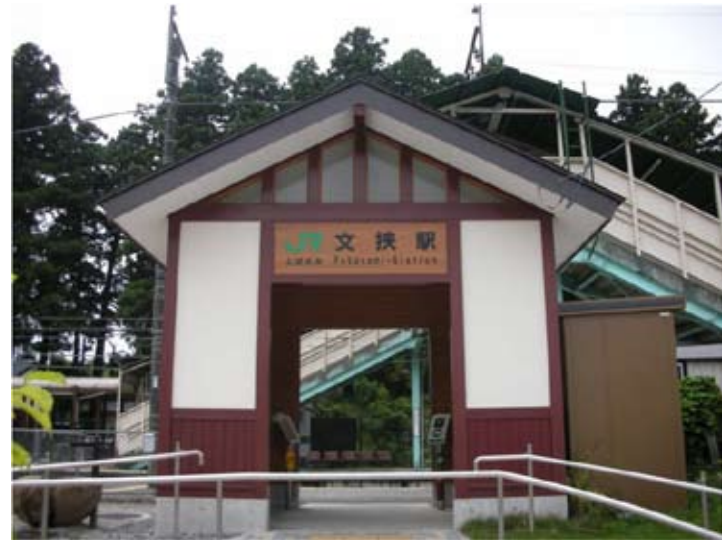
⑫JR日光線 文挟駅 (背景のスギは日光例幣使街道沿いのスギ並木)