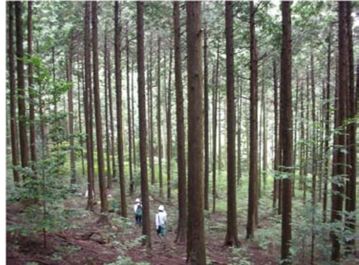
⑥ヒノキ林(緩傾斜地)