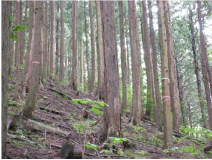
⑤支障木 (赤テープ巻き:隣接林分の伐採搬出のため近々伐倒するもの)