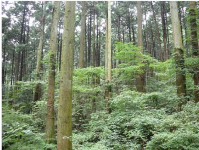
⑦沢沿いのスギ林(70年生)