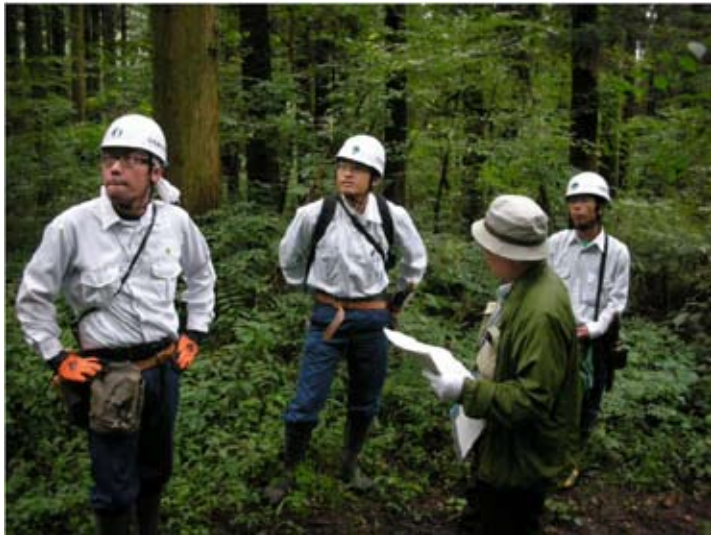
③日光森林管理署業務課長外