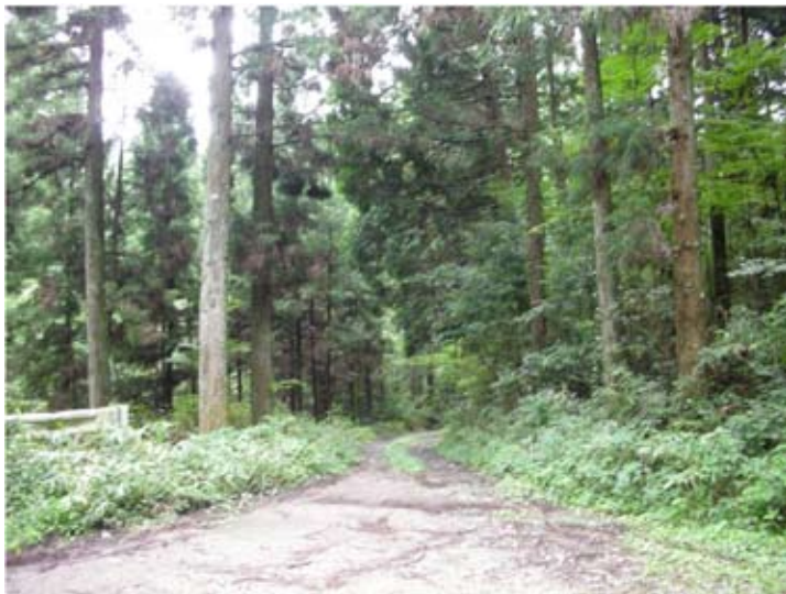
⑪部分林に至る林道