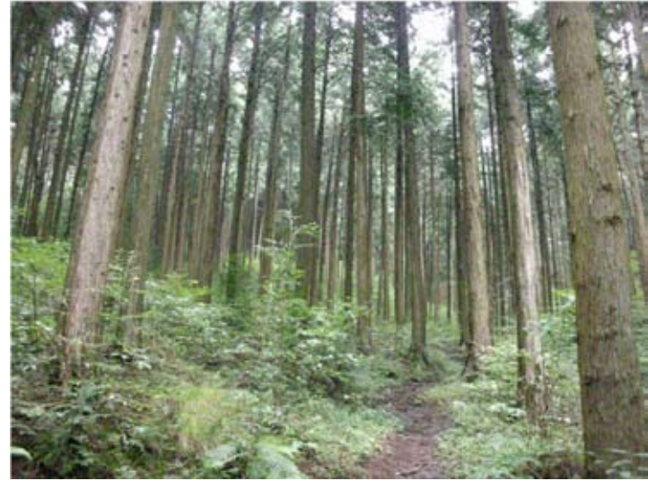
②歩道沿いの林相 (昭和14~16年植栽)